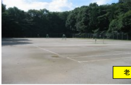
老人福祉センターの裏になります