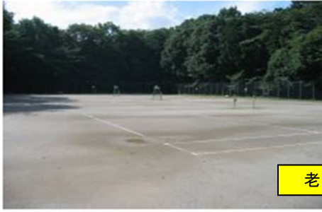
老人福祉センターの裏になります